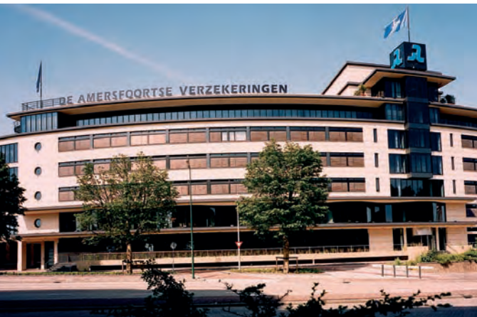
De Amersfoortse heeft vorig jaar marktaandeel verloren.

met significant meer waarde voor de consument tegen een beduidend lagere provisie (tot 35%) voor de bemiddelaar. Gevolg van deze maatregel was dat het marktaandeel gedaald is van ongeveer 50% naar slechts 3%, waardoor Cardif geen rol van betekenis meer speelt op deze markt", aldus de woordvoerder.