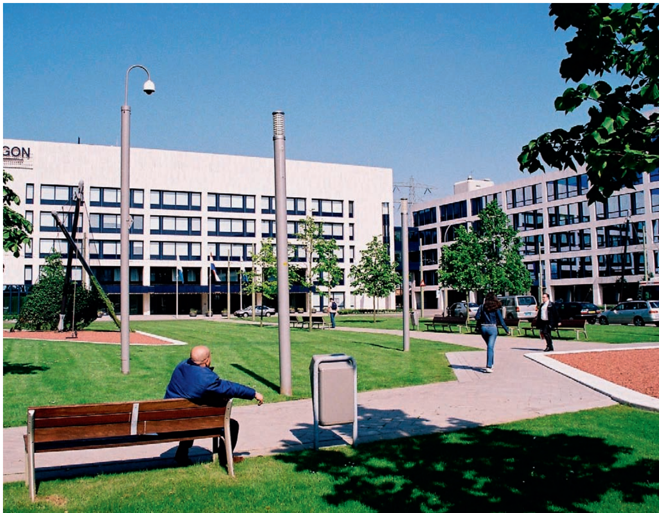
Aegon boekte vergeleken met de andere grote levensverzekeraars goede resultaten.